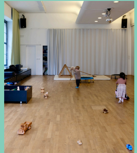
Bildlegend von links oben im Uhrzeigersinn: Gutzibacken für Halt Gewalt, Jubiläumsfest Dorfplatz BURGweg, Kerzenziehen mobile Altersarbeit, Flohmi BURG, Mobile Quartierarbeit Landhof [Nacht und Flamme], offener Eltern-Kind-Treff