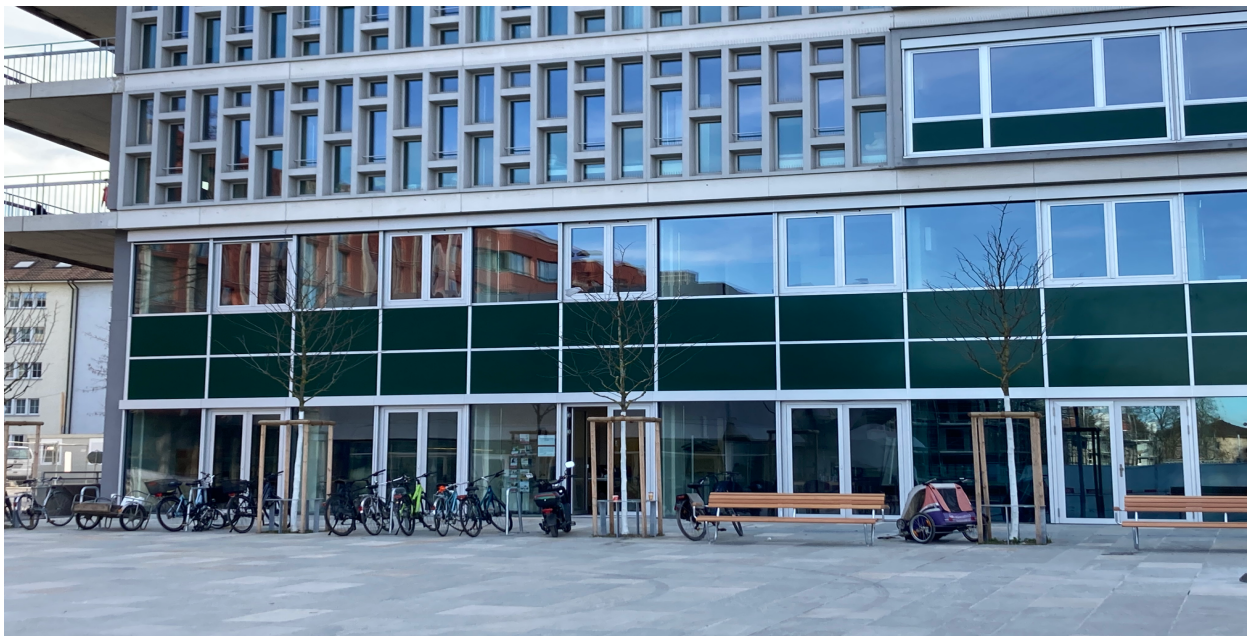
Bild: Das Schiff

Bei den finanziellen Grundlagen ging es in erster Linie darum, Gespräche mit Kanton, Politik und Stadtteileskretariat zu führen und den Staatsbeitrag definitiv zu sichern (der Vertrag wurde seitens Kanton am 20. Dezember unterschrieben, der zugesicherte Betrag ging als Weihnachtsgeschenk am 23. Dezember auf unserem Konto ein). Die personellen Grundlagen beinhalteten das Verfassen des Stellenbeschreibs und der Ausschreibung, die Publizierung des Inserats, die Durchführung des Bewerbungsverfahrens und der Anstellung inklusive aller dazugehörigen Versicherungen. Die räumlichen Grundlagen setzten sich aus den Verhandlungen mit der Genossenschaft wohnen&mehr zusammen im Hinblick auf die Finalisierung des Mietvertrags sowie der Organisation der Ausstattung und der Anschaffungen.