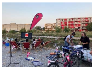
grosser Andrang im La Spiaggia – Besuch der MJA