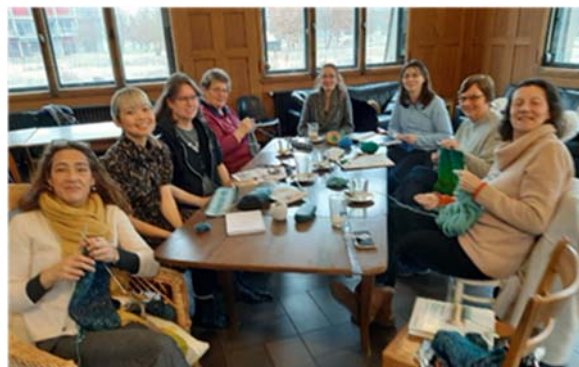
Unsere sympatische Strickgruppe (Foto 2019)