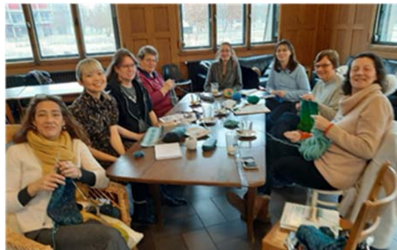
Unsere sympatische Strickgruppe (Foto 2019)