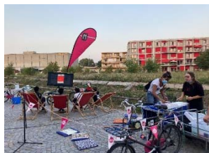
grosser Andrang im La Spiaggia – Besuch der MJA