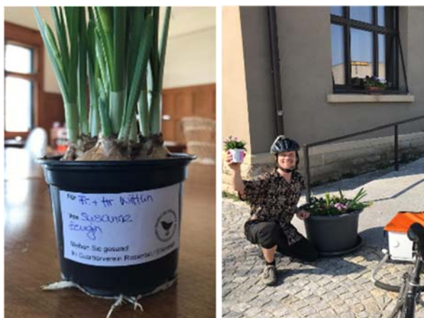
Vorbereitungen Aktion Blumenlieferung