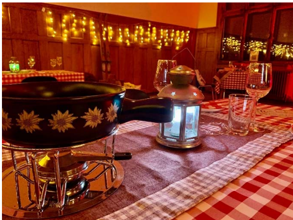
Das gemütliche Le Chalet

Das darauffolgende Gastro-Angebot le Chalet – Käsefondue im Innenbereich - konnte Coronabedingt leider nur wenige Mal stattfinden.