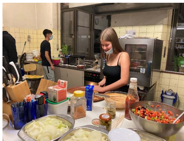
Die Jugendlichen des WoZi in Action

Das ist der Ausblick, der uns vorschwebt. Dass alle Bewohner*innen des Erlenmatt/Rosentals, einen gemeinsamen Platz haben, wo sie sich begegnen, austauschen und sich aktiv am Quartierleben beteiligen oder auch nur konsumieren können.