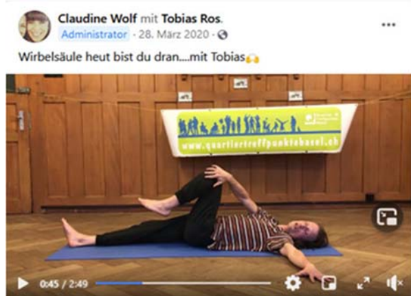
Facebook Videos zum Thema Bewegung