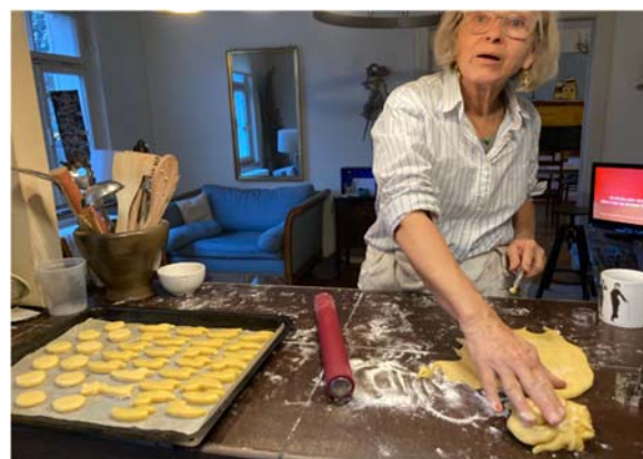
Es wird geknetet, ausgewallt und ausgestochen