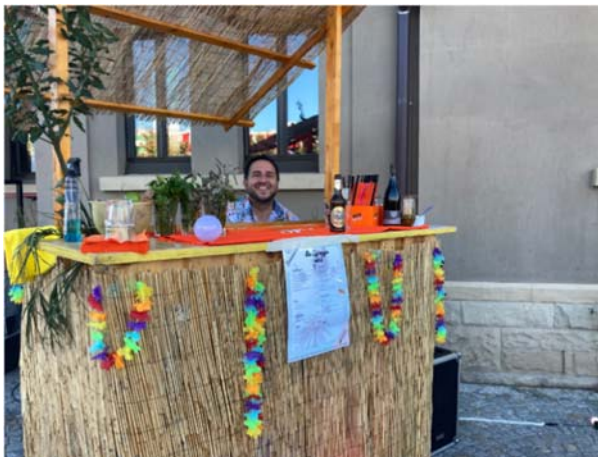
Die La Spiaggia Bar

Mit der Abendbar LaSpiaggia öffneten sie den Quartiertreffpunkt auch am Abend und sorgten so für einen neuen Begegnungsort der gut angenommen wurde.